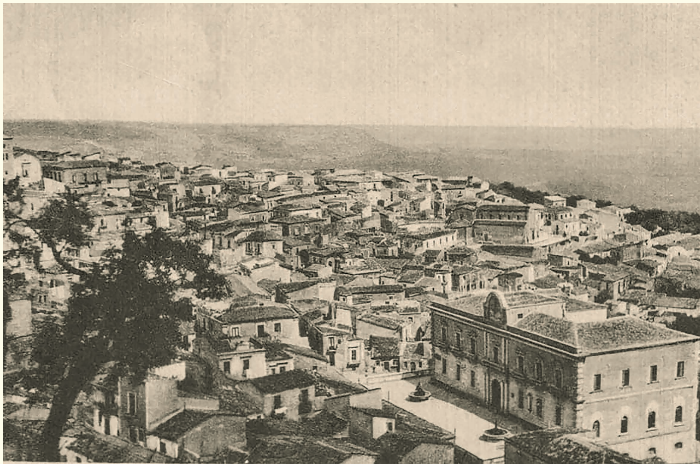
Panorama di Melilli degli anni '50